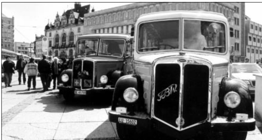
Auch in diesem Jahr präsentieren sich zum Treffen Bus-Oldtimer in der Saalestadt.

Für eine Terminvereinbarung stehen die Mitarbeiter der Clearingstelle in der Bodestraße 1 dienstags von 13 bis 17 Uhr sowie nach telefonischer Absprache, Tel. (03 45) 8 04 02 43, auch an den anderen Wochentagen zur Verfügung.