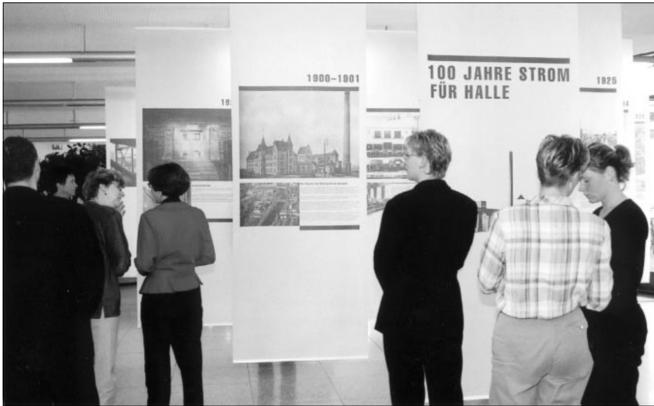
Zur Geschichte der halleischen Stromversorgung informiert bis zum 9. November eine Ausstellung der Energieversorgung Halle GmbH im Kundencenter der Stadtwerke. Vor 100 Jahren, am 28. August, begann die Geschichte der halleischen Stromversorgung. Sie wird anhand von 29 großformatigen Fotografien aus Geschichte und Gegenwart dokumentiert. Die Exposition ist montags bis freitags von 8 bis 18 und sonnabends von 9 bis 12 Uhr geöffnet.

Seit zwei Jahren arbeitet die Clearingstelle, Bereich Jugendberufshilfe, erfolgreich: