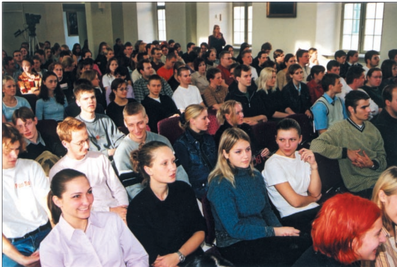
Im Freylinghausen-Saal der Franckeschen Stiftungen fand am 16. Oktober die Immatrikulation der 2 700 Studenten statt, die sich für das Wintersemester eingeschrieben haben.

Das Stadtplanungsamt Halle lädt in Vorbereitung von Planungen für das Zentrum Halle-Ammendorf (Bereich Merseburger Regensburger Straße) zu einer öffentlichen Bürgerdiskussion ein. Diese findet am Montag, 5. November, 17 Uhr, in der Aula des Frieden-Gymnasiums, Kurt-Wüsteneck-Straße 21, 06132 Halle (Saale), statt. Dabei sollen - in Ergänzung zur Stadtteilkonferenz mit Oberbürgermeisterin Ingrid Häubler im August dieses Jahres - im Dialog der Anwohner mit dem Stadtplanungsamt und dem beauftragten Architekturbüro städtebauliche und infrastrukturelle Vorstellungen der Anwohner und interessierten Bürger besprochen werden. Es ist vorgesehen, die Ergebnisse in die langfristige Entwicklungsplanung für das Zentrum Ammendorf einfließen zu lassen.