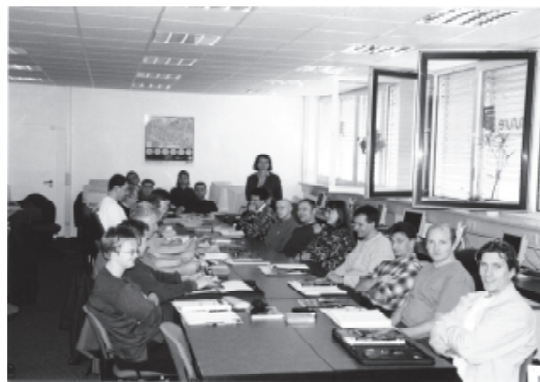
Die derzeitige Klasse der zukünftigen Fachinformatiker.