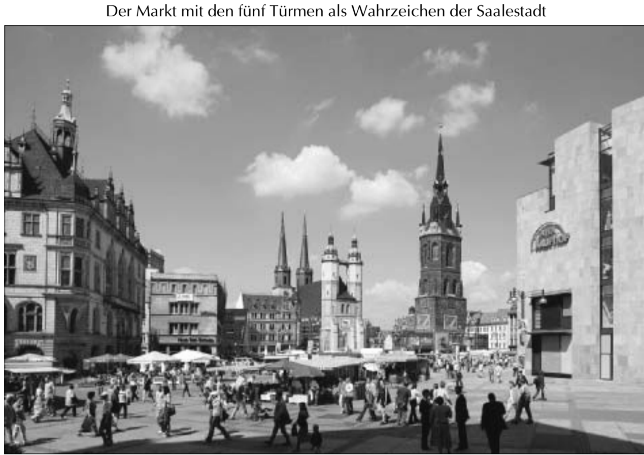
Blick auf den halleschen Marktplatz mit Stadthaus, Marktkirche, Rotem Turm und Kaufhof-Neubau.

Der Bereich „An der Marienkirche“ wurde vollständig in die Planung einbezogen, da ein wesentliches Ziel der Marktplatzgestaltung auch die Verbesserung der Anbindung des Hallmarktes an den Marktplatz ist.