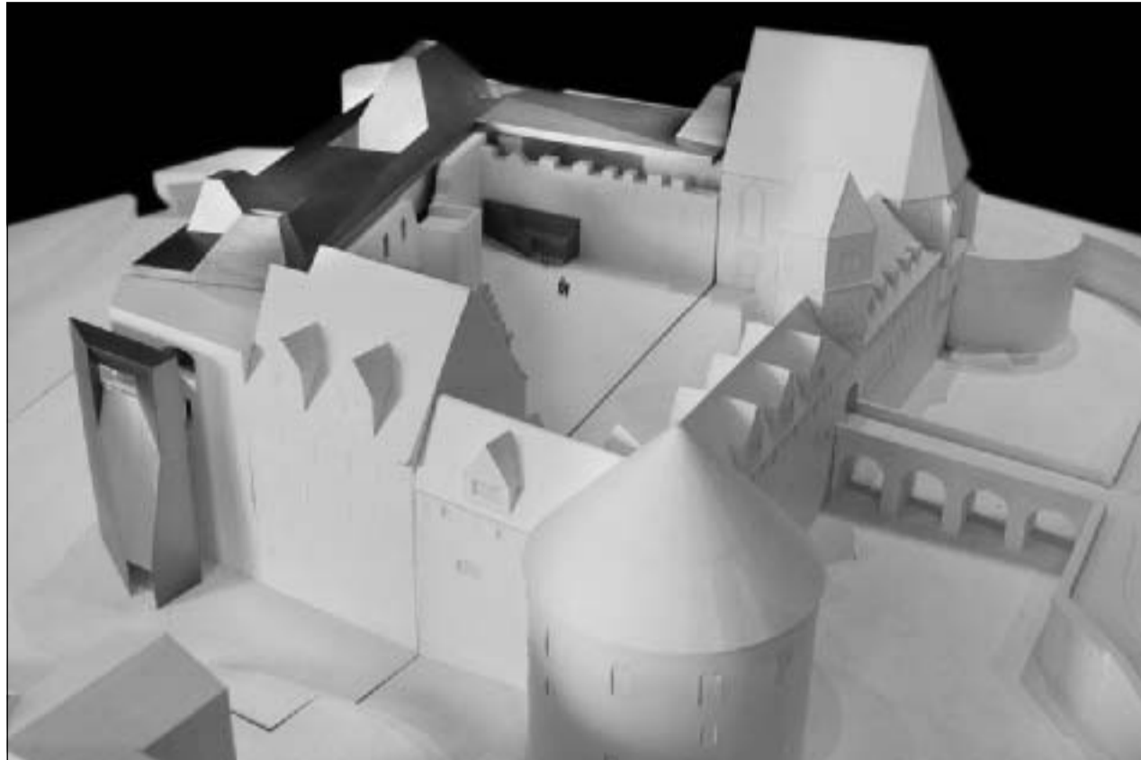
Das Architekturbüro Nieto Sobejano Arquitectos aus Madrid hat mit seinem Modell-Vorschlag zum Neubau des Landeskunstmuseums Stiftung Moritzburg den Wettbewerb zum Thema „Neubau und Erweiterungsbau der Ausstellungsfläche“ gewonnen. Über 300 Architekturbüros beteiligten sich am Auswahlverfahren zu dem internationalen Architektenwettbewerb, den die Stiftung Moritzburg ausgelobt hatte.