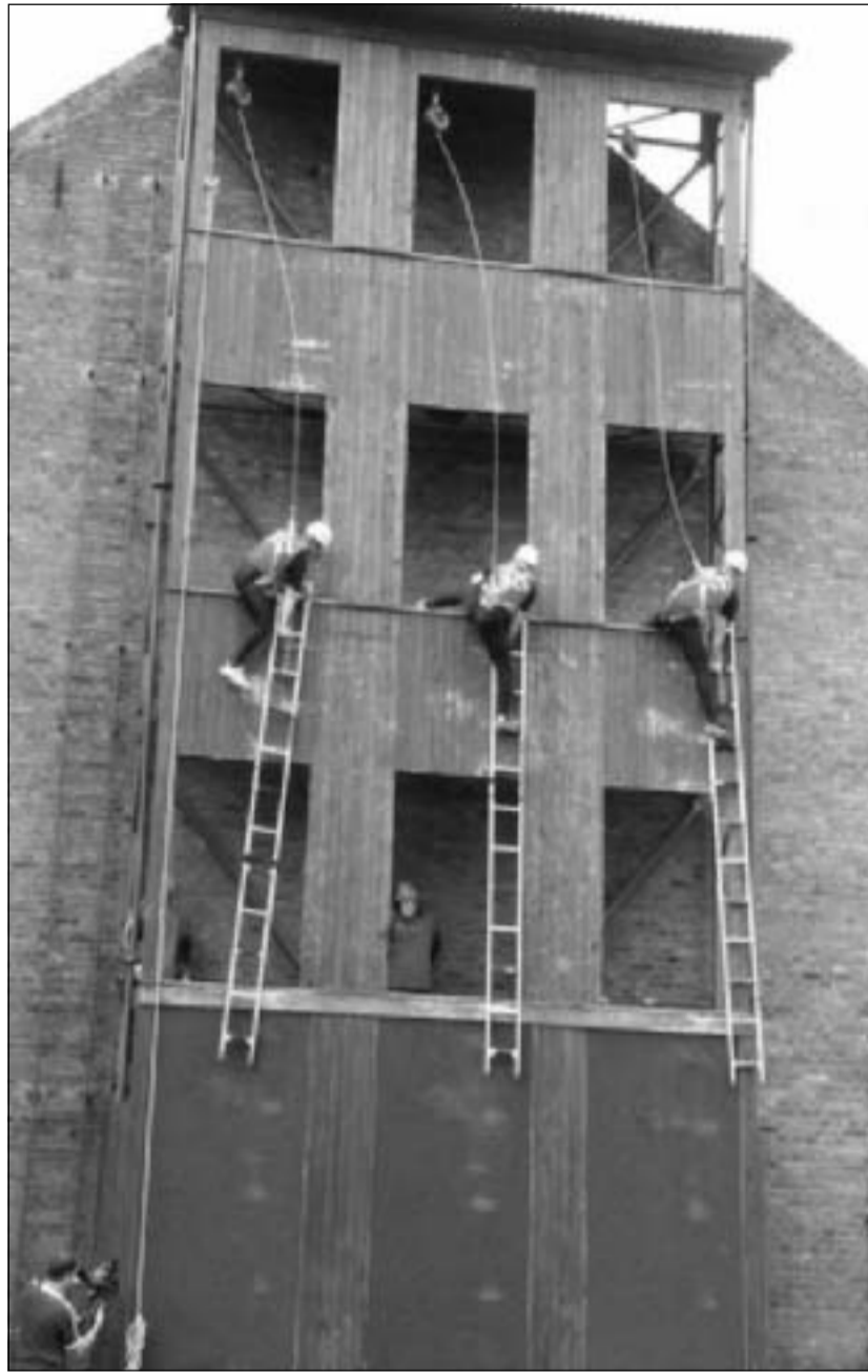
Gehört zu den Wettkampf-Disziplinen: Aufstieg mit Hakenleitern.