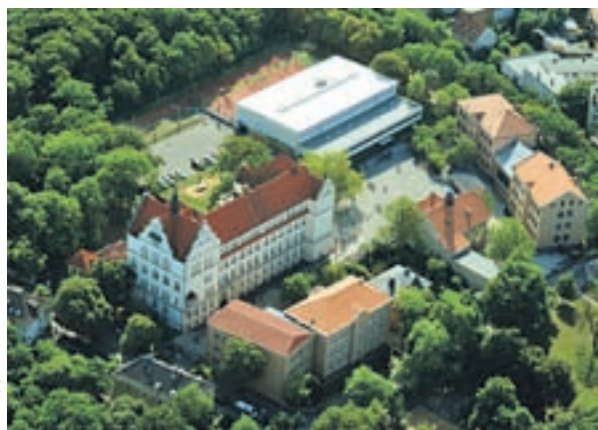
Giebichenstein-Gymnasium „Thomas Müntzer“

Bereits 2004 hat sich die Stadt Halle entschlossen, mit Hilfe von Public Private Partnership (PPP) neue Wege zur Aufrechterhaltung der Schul- und Kitainfrastruktur zu gehen. Im Rahmen eines PPP-Projektes sollte der Stadt trotz äußerst angespannter Haushaltssituation die Durchführung dringender und unabwendbarer Investitionen an Brennpunkten im Schul- und Kitabereich ermöglicht werden.