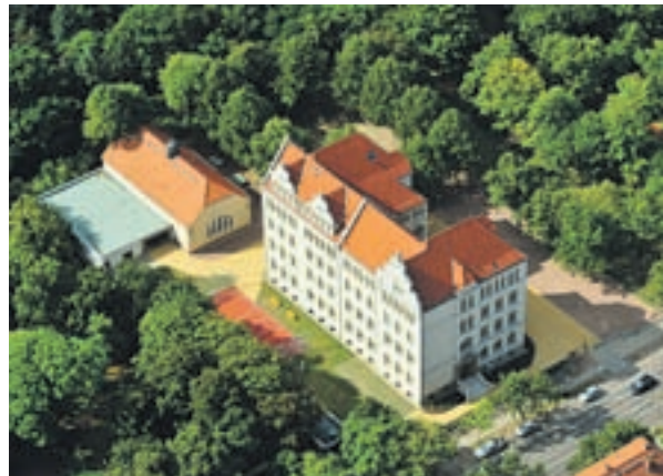
Grundschule „Ulrich von Hutten“ / Hort JW „Frohe Zukunft“