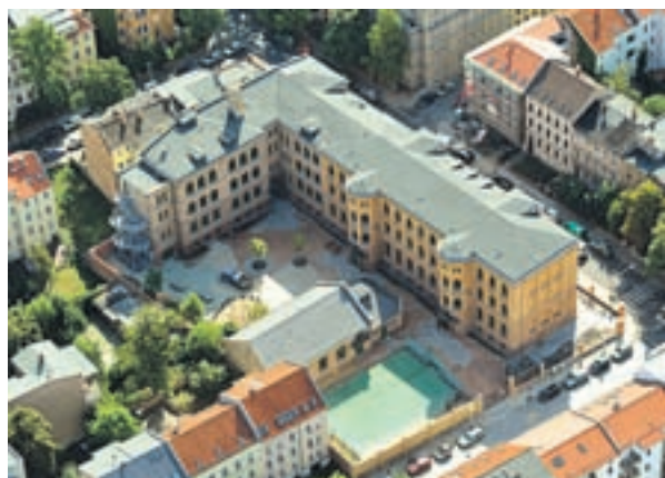
Grundschule „Neumarkt“ und Hort DRK