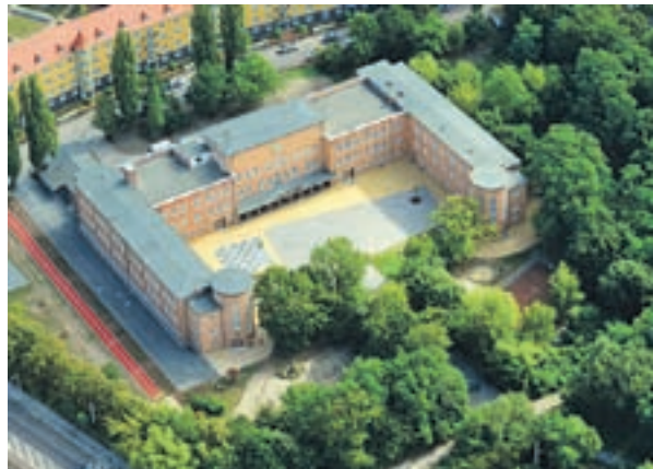
Förderschule Pestalozzi, Vor dem Hamstertor

Halle wurde wegen der beispielhaften Vorbereitung als kommunales Pilotprojekt ausgewählt