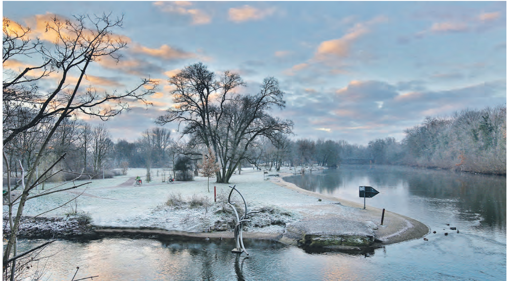
Winterliche Atmosphäre am Saaleufer mit Blick auf den Saalestrand an der Ziegelwiese