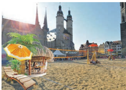
Erst Beachvolleyball-Wettkämpfe, dann Beach-Bar – auf der temporären Sandfläche könnte am Abend eine Freiluft-Bar eingerichtet werden.