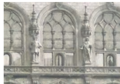
Bis 1951 zierten die Fensterfront des Stadthauses historische Skulpturen. Geplant ist die Fassade in einem Kunst-am-Bau-Wettbewerb neu gestalten zu lassen.