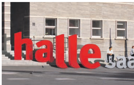
Ein übergroßes Halle-Logo könnte zu den beliebtesten Fotomotiven bei Gästen werden. Mit der Verbreitung der Bilder erhält die Stadt kostenfreie Werbung.