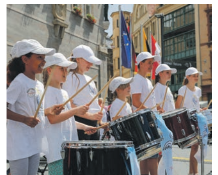
Die Gruppe „Trommelwirbel“ vom Verein „Ein Schutzengel für Kinder“ unterstützte „Halle singt“ tatkräftig.