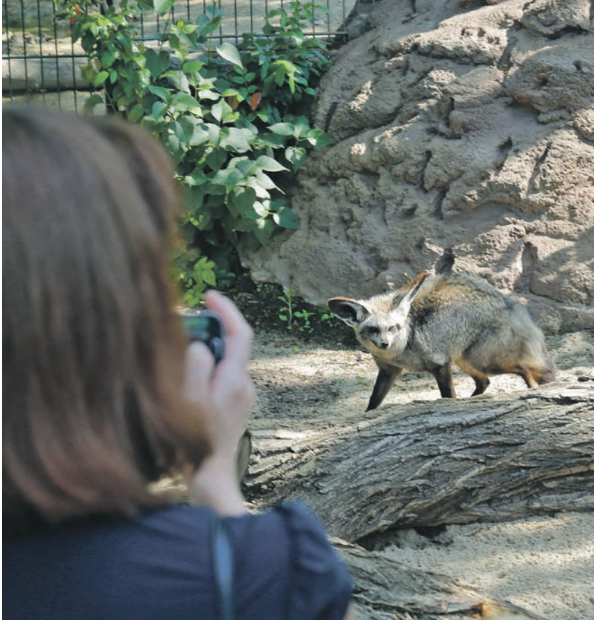
Der Löffelhund ist ein Wildhund der afrikanischen Savanne, der sich hauptsächlich von Termiten ernährt. Benannt ist er nach seinen auffälligen, großen Ohren mit denen er leiseste Geräusche von Termiten in deren Bauten hören kann.