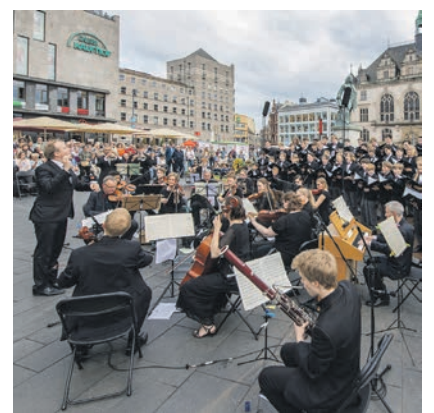
Mit einer Feierstunde am Händel-Denkmal wurden die Festspiele eröffnet.