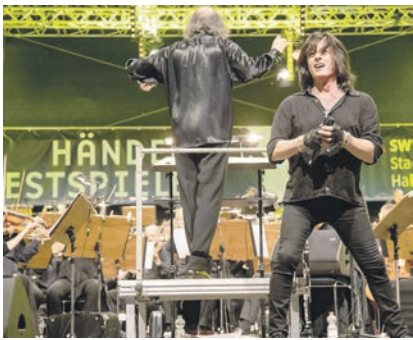
Stargast bei „Bridges to Classics“: Joe Lynn Turner, Sänger bei Deep Purple