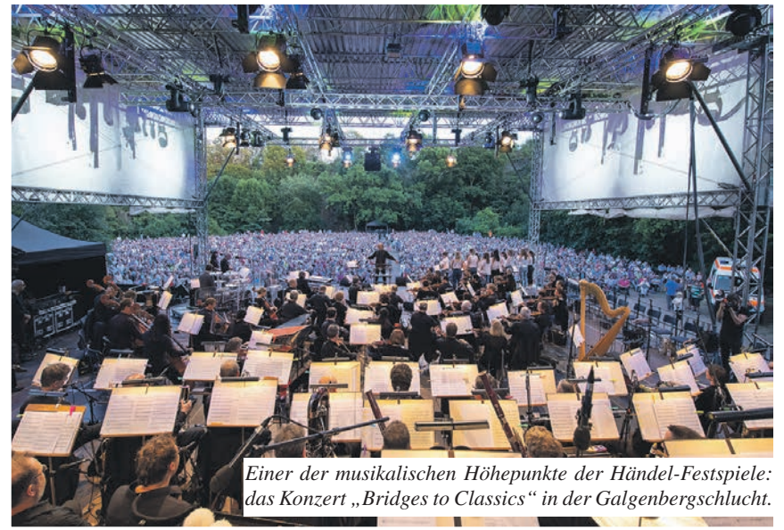
Einer der musikalischen Höhepunkte der Händel-Festspiele: das Konzert „Bridges to Classics“ in der Galgenbergschlucht.

Die Stadt hat im Juni vielfältige Klangerlebnisse geboten.