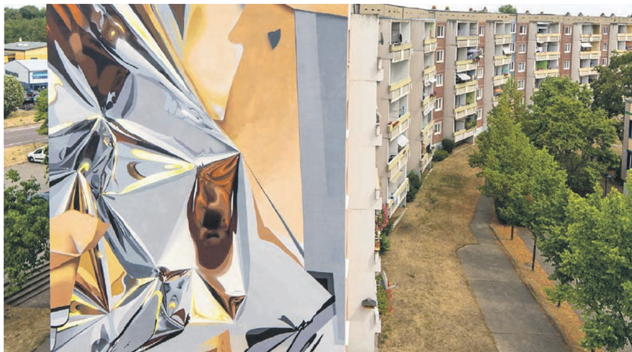
Ein Künstlerkollektiv hat 2018 die Fassade des fünfgeschossigen Wohnhauses in der Freyburger Straße 4 auf der Silberhöhe mit einem abstrakten Bild gestaltet. Die Aktion wurde von der Freiraumgalerie initiiert.

Stadt entwickelt Projekt mit Freiraumgalerie – Weitere Aktionen geplant