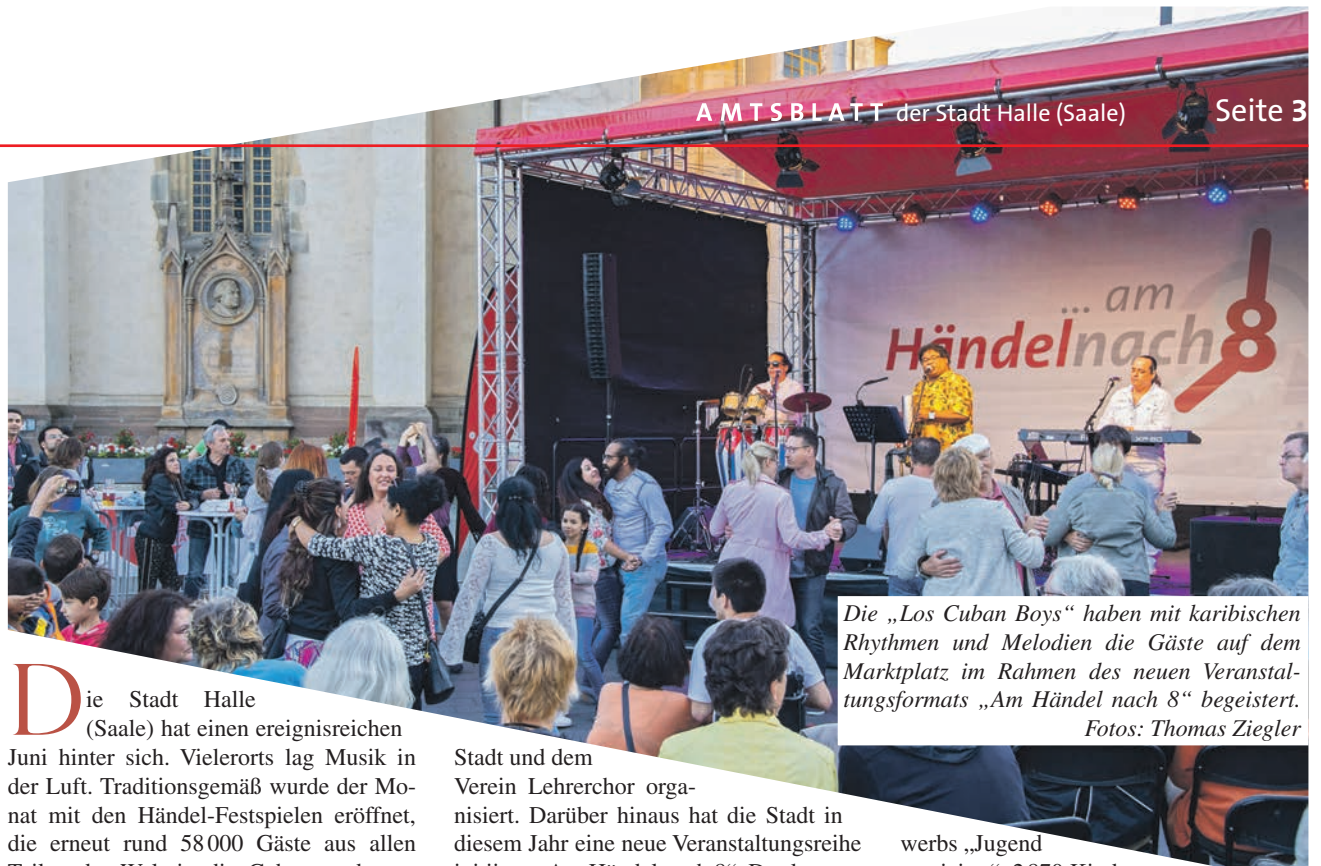
Die „Los Cuban Boys“ haben mit karibischen Rhythmen und Melodien die Gäste auf dem Marktplatz im Rahmen des neuen Veranstaltungsformats „Am Händel nach 8“ begeistert.

Die Stadt Halle (Saale) hat einen ereignisreichen Juni hinter sich. Vielerorts lag Musik in der Luft. Traditionsgemäß wurde der Monat mit den Händel-Festspielen eröffnet, die erneut rund 58000 Gäste aus allen Teilen der Welt in die Geburtsstadt von Georg Friedrich Händel zogen. Auf dem Programm standen rund 100 Veranstaltungen an 22 verschiedenen Orten. Es gab Opern-Premieren, Festkonzerte mit internationalen Stars und zahlreiche kostenfreie Angebote, darunter „Halle singt“. Das gemeinsame Singen auf dem Marktplatz wurde bereits zum vierten Mal von der