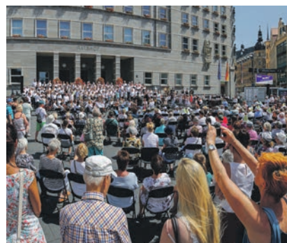
Insgesamt 14 Chöre und zahlreiche Besucherinnen und Besucher beteiligten sich an „Halle singt“.