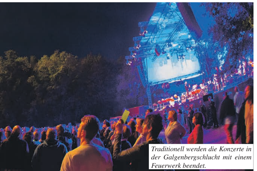
Traditionell werden die Konzerte in der Galgenbergschlucht mit einem Feuerwerk beendet.