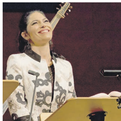
Die Händel-Preisträgerin von 2017, Vivica Genaux, gestaltete ein Festkonzert.