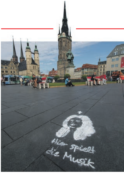
Händel-Wegweiser leiten Gäste zu den Veranstaltungsorten.