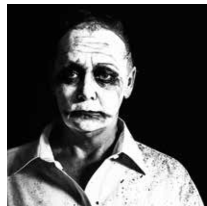
Das Schauspiel „Nathan der Weise“ feiert am 20. September Premiere im neuen theater.