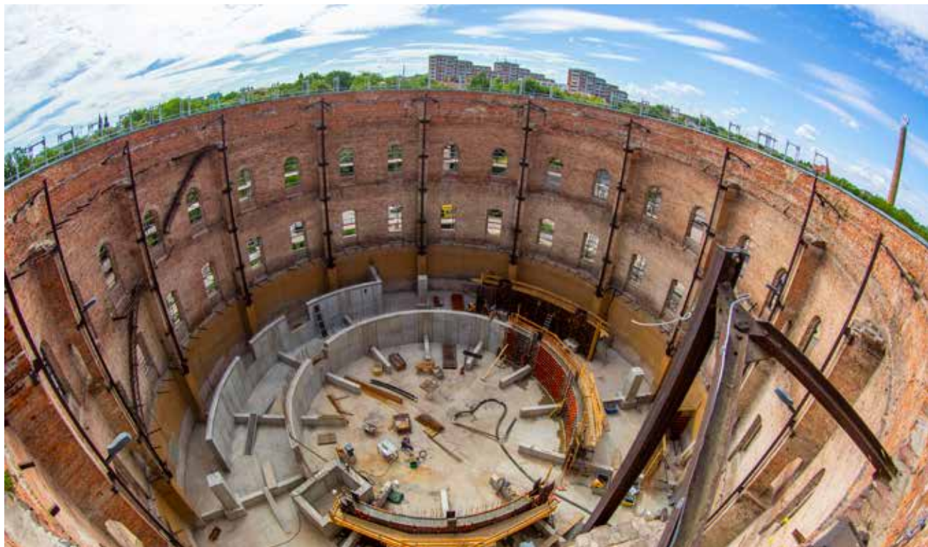
Die Arbeiten am neuen Planetarium im ehemaligen Gasometer am Holzplatz schreiten weiter voran.

Der Herbst steht vor der Tür und beginnt laut astronomischem Kalender am 23. September. In den immer länger werdenden Nächten sind nun gut die Herbststernbilder wie Andromeda oder der große Pegasus zu sehen. In letzterem Sternbild wurde vor knapp einem Vierteljahrhundert erstmalig ein Planet entdeckt, welcher sich um einen anderen Stern, ähnlich unserer Sonne, bewegt. Dieser extrasolare Planet (kurz Exoplanet) mit der Bezeichnung 51 Pegasi b befindet sich in einer Entfernung von etwa 51 Lichtjahren, das sind 510 Billionen Kilometer. Seit dieser Entdeckung wurden mit immer besseren