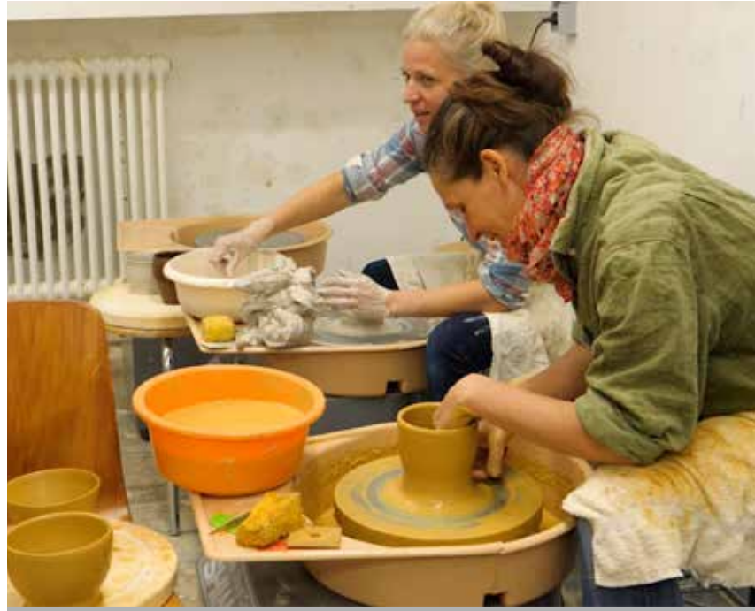
Die Volkshochschule bietet ein vielfältiges Angebot für verschiedene Zielgruppen an – von Sprachen über Sport bis hin zu Kunst und Kultur.

Es ist das große Jubiläumsjahr der Volkshochschulen: In diesem Jahr feiern bundesweit rund 900 Einrichtungen ihr 100-jähriges Bestehen und öffnen am Freitag, 20. September , ab 18 Uhr für eine „Lange Lern-Nacht“ ihre Türen. So auch die Volkshochschule Adolf Reichwein der Stadt Halle (Saale). Unter dem Motto „zusammenleben. zusammenhalten“ können Interessenten an diesem Abend Schnupperkurse quer durch das Programm besuchen.