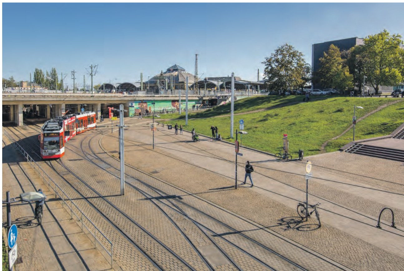
Auf der Südostseite des Riebeckplatzes soll ein Hotel mit Fahrrad-Parkhaus entstehen.