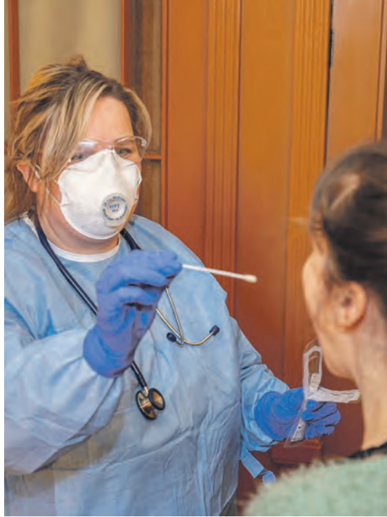
Der mobile Fahrdienst der Kassenärztlichen Vereinigung ist im Auftrag der Stadt Halle (Saale) unterwegs und führt nach vorheriger telefonischer Anmeldung Abstriche bei Hallenserinnen und Hallensern zu Hause durch.