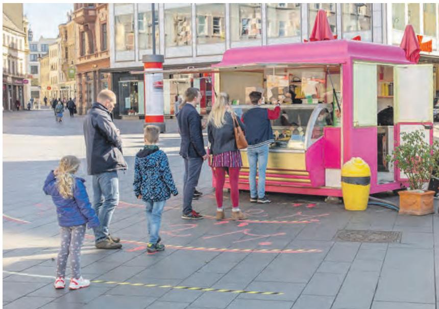
Alle sind angehalten, die physischen und sozialen Kontakte zu anderen Menschen auf ein absolut nötiges Minimum zu reduzieren. Wo immer möglich, ist ein Mindestabstand zwischen zwei Personen von anderthalb Metern einzuhalten. Das gilt auch beim Warten in der Schlange vor dem Eis-Stand auf dem Marktplatz.