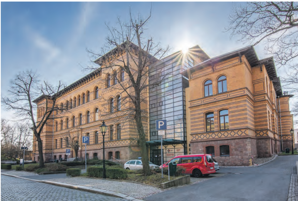
Das Universitätsklinikum Halle (Saale) hat eine Unterbringungsmöglichkeit für an COVID-19-erkrankte Menschen mit leichten Symptomen geschaffen. Am Standort Medizin-Campus Steintor, Magdeburger Straße 22, wurde in der ehemaligen Klinik für Orthopädie eine „Corona-Klinik“ eingerichtet. Die Universitätsmedizin wird von allen halleischen Krankenhäusern und der Stadt Halle (Saale) unterstützt. Die Corona-Klinik ist seit 26. März 2020 in Betrieb.