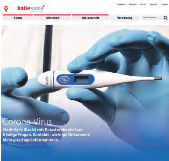
Die Stadt informiert tagesaktuell zum Corona-Virus auf der Internetseite. Hier sind auch die Allgemeinverfügungen, zentrale Ansprechpartner und der Livestream zur täglichen Pressekonferenz abrufbar: www.halle.de