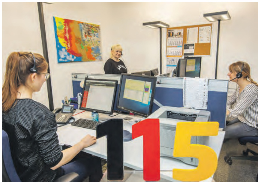
Die städtischen Verwaltungsstandorte sind für den regulären öffentlichen Besucherverkehr derzeit nicht zugänglich. Stattdessen nehmen Mitarbeiterinnen und Mitarbeiter der Stadtverwaltung Anliegen von Bürgerinnen und Bürgern entgegen – 24 Stunden am Tag, telefonisch unter der Behördennummer 115.