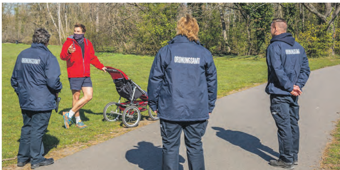
Städtische Ordnungskräfte kontrollieren unter anderem auf der Ziegelwiese, ob die Beschränkungen der Eindämmungsverordnung des Landes Sachsen-Anhalt eingehalten werden. Dabei kommen sie auch mit Hallenserinnen und Hallensern ins Gespräch, die Fragen zum Umgang mit dem Corona-Virus haben. So ist beispielsweise erlaubt, zu zweit Sport im Freien zu treiben. Picknicken oder grillen sind hingegen untersagt.