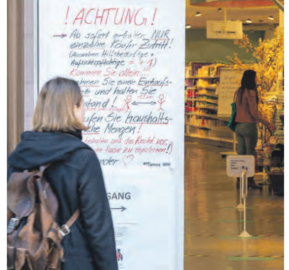
Neben Lebensmittelhändlern dürfen auch Wochenmärkte und Drogerien öffnen – unter besonderen Auflagen. Warteschlangen sollen vermieden und ein Sicherheitsabstand von anderthalb Metern eingehalten werden.