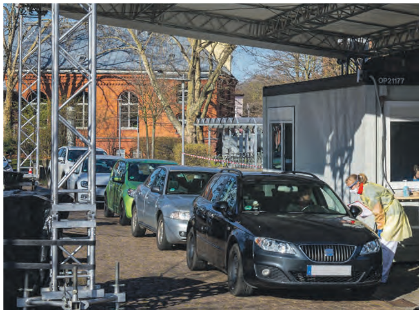
Die Stadt hat in Kooperation mit der Poliklinik Reil und der Arbeitsagentur eine mobile Test-Station in Betrieb genommen. Hier können sich Hallenserinnen und Hallenser aus dem eigenen Fahrzeug heraus testen lassen, täglich von Montag bis Sonntag von 9 bis 16 Uhr. Das Modul steht auf dem Parkplatz der Arbeitsagentur in der Schopenhauerstraße 2. Mitzubringen ist die Gesundheitskarte bzw. Krankenversicherungsnummer. Jede Person mit Atemwegserkrankungen jedweder Schwere sollte vorsorglich einen Corona-Test durchführen lassen.