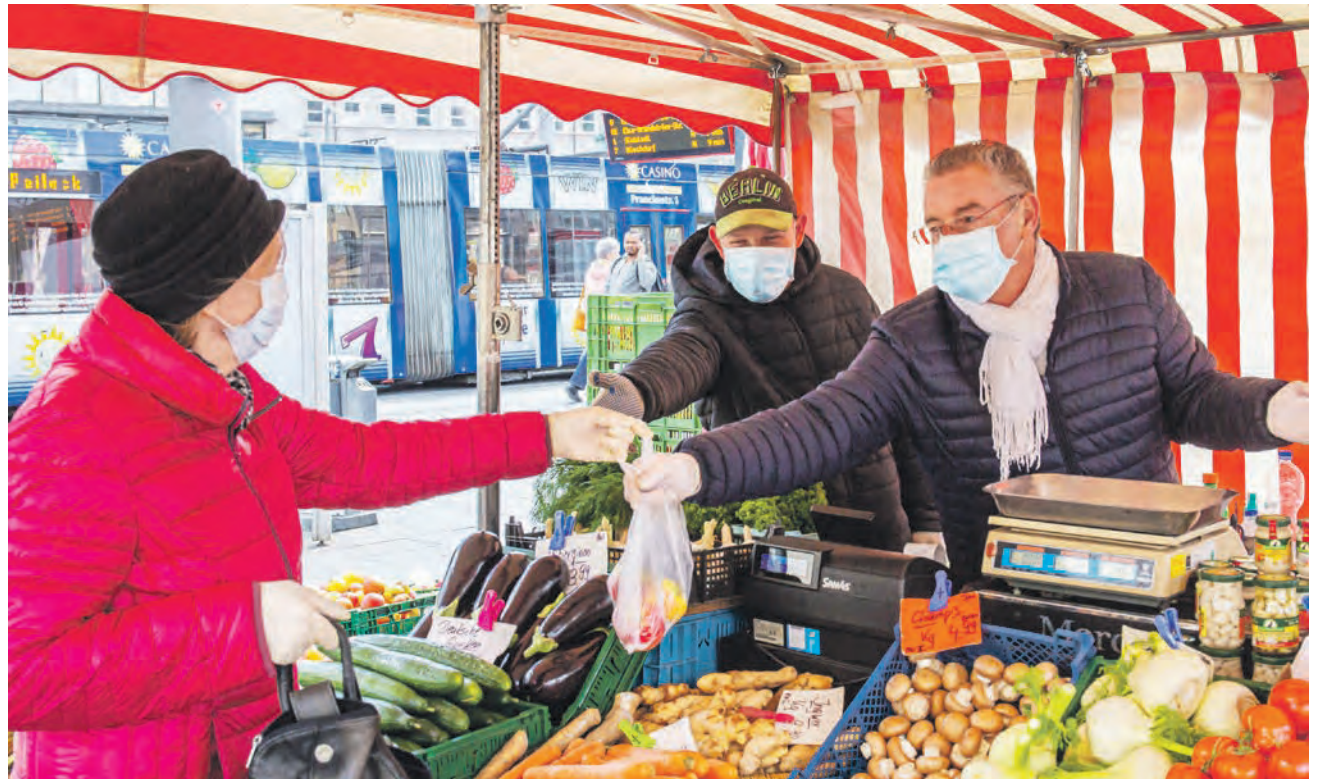
Die Stadt empfiehlt das Tragen von Mund-Nasen-Schutzmasken an Orten, an denen viele Menschen zusammenkommen, beispielsweise auf dem Wochenmarkt auf dem Marktplatz.

Das Amtsblatt kann auf der Internetseite der Stadt abgerufen werden. Dort stehen auch die weiteren Erscheinungstermine für das Jahr 2020. Hallenserinnen und Hallenser, die das Amtsblatt ab sofort kostenfrei per E-Mail beziehen wollen, können sich über die Internetseite der Stadt anmelden. Dafür muss eine E-Mail-Adresse angegeben werden: www.amtsblatt.halle.de