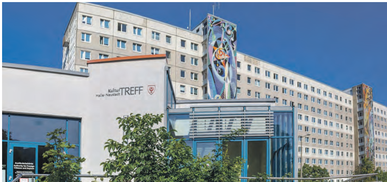
Der KulturTreff in Halle-Neustadt wird inhaltlich neu ausgerichtet.