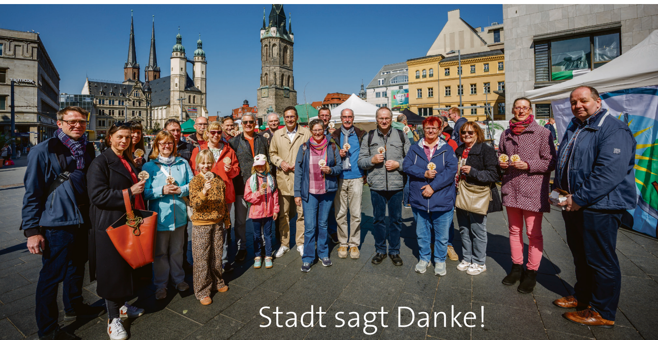
Anlässlich des „Tags des Baumes“ am 25. April hat sich die Stadt bei allen Hallenserinnen und Hallensern sowie Vereinen und Unternehmen bedankt, die für die vergangene Pflanzsaison eine Baumpatenschaft abgeschlossen haben. Mit der Unterstützung von 52 Patinnen und Paten konnten insgesamt 54 Bäume gepflanzt werden. Noch bis 31. Mai können Patenbäume für die kommende Pflanzsaison ausgewählt werden. Momentan sind noch knapp 30 Standorte für Patenbäume frei. Weitere Informationen zu Baumpatenschaften sowie eine digitale Pflanzstandort-Karte finden sich im Internet unter: baumpatenschaft.halle.de

Die Netzwerkrunde Büschdorf und das städtische Quartiermanagement Ost laden immer montags, 16 bis 17 Uhr, zur Neuauflage der beliebten Veranstaltungsreihe „Büschdorf singt“ ein. Bis Ende September können sich Singbegeisterte vor der „ProCurand Seniorenresidenz am Hufeisensee“, Franz-Maye-Straße 27, treffen und gemeinsam singen. Musikalische Vorkenntnisse sind nicht erforderlich; die Freude am Singen steht im Vordergrund. Die Teilnahme ist kostenfrei. Liederhefte werden vor Ort bereitgestellt.