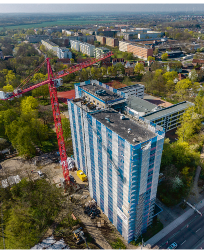
Rückbau mit Kran

Der Rückbau des Hochhauses an der Richard-Paulick-Straße für den künftigen „Campus Halle-Neustadt“ hat im April mit Arbeiten im Gebäudeinneren und der Dachdemontage begonnen. Zudem werden an der Fassade des ehemaligen Studentenwohnheims asbesthaltige Fugen fachgerecht ausgebaut und entsorgt. Bis voraussichtlich August folgt der plattenweise Rückbau. Besondere Herausforderungen ergeben sich aus den beengten Platzverhältnissen auf dem Baugrundstück und der Nähe zu den beiden Schulen. Ursprünglich war der Rückbau bis Ende 2025 geplant, jedoch musste zuvor – anders als erwartet – im Gebäude eine umfangreiche Schadstoffsanierung bzw. -beseitigung durchgeführt werden. Grund waren asbestbelastete Fußbodenaufbauten, erhebliche Mengen Taubenkot sowie asbesthaltige Bauteile im Inneren des Gebäudes. Bedingt durch die Historie des Hochhauses wurden im Zuge der Sanierung weitere belastete Bauteile entdeckt. In der Folge mussten die Arbeitsabläufe teils grundlegend geändert werden, um einen fachgerechten Umgang mit den Schadstoffen zu gewährleisten. Mit dem „Campus Halle-Neustadt“ will die Stadt Halle (Saale) an der Kastanienallee ein modernes Bildungsareal errichten. Die Kosten belaufen sich auf rund 14,7 Millionen Euro und werden zu 90 Prozent von der Europäischen Union und dem Land Sachsen-Anhalt gefördert.