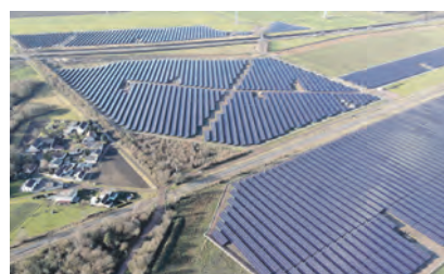
Luftaufnahme des Solarparks Merbitz

Die Umsetzung des Solarparks erfolgte in mehreren Meilensteinen: Nach dem Auftrag zur Errichtung des Umspannwerks im II. Quartal 2024 und dem Erhalt der Baugenehmigung im darauffolgenden Quartal wurden im April 2025 die Projektrechte erworben. Im Juli 2025 folgten der Abschluss der wesentlichen Vertragswerke sowie der Baubeginn des Solarparks, der im I. Quartal dieses Jahres in Betrieb genommen werden konnte. Die Fertigstellung des Umspannwerks ist noch im aktuellen Quartal vorgesehen.