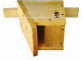
Nistkasten Hausrotschwänze 14x