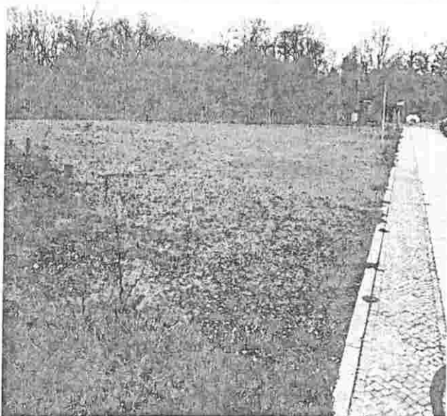
Abb. 2: Parkplatz Spitze, ehemalige Blühwiese und Blick auf die kleinkronige Baumreihe (Foto:

Auch innerhalb der jetzt zu bebauenden Flächen werden mehr geeignete Pflanzen für Insekten benötigt. Durch den Verzicht auf individuelle Gärten, die Schaffung von ca. 200 Parkplätzen und der Anlage von lediglich als "Rasen" gepflegten Grünflächen wird dieser Artenverlust keineswegs aufgefangen. Besonders tragisch für die Vielfalt der Schmetterlingskultur auf der Saline war etwa die Beseitigung der Sommer- und Blühwiese auf der Spitze und ihre Umgestaltung in einen bisher ungenutzten, graugeschotterten Parkplatz, der sich auch gestalterisch als Fiasko ausnimmt, zumal er an einer der schönsten Flächen gleich neben dem Stadthafen liegt. Einige Schmetterlingsarten kann ich seit dem auf der Saline nicht mehr finden.