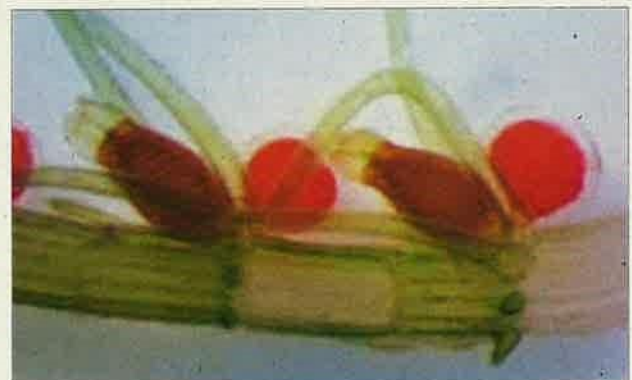
Die Fortpflanzungsorgane der Characeen sind einzigartig im gesamten Pflanzenreich. Hier sind Antheridien und Oogonien der Feinen Armleuchteralge ( Chara virgata) zu sehen. Weddendorf, 13.5.2012