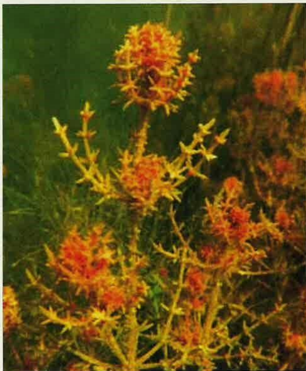
Eine der größten und auffälligsten Characeen ist die Hornblättrige Armleuchteralge ( Chara tomentosa), die in Sachsen-Anhalt nur noch bei Halle und Eisleben vorkommt. Halle, 20.6.2013

Die wichtigsten Ursachen für den Rückgang vieler Armleuchteralgen sind die Eutrophierung der Gewässer aufgrund von Nährstoffeinträgen aus der Umgebung oder durch intensive Fischhaltung. Außerdem wurden infolge der Melioration und der Umgestaltung der Auen viele Kleingewässer in der Landschaft beseitigt und die natürliche Dynamik entlang der Fließgewässer unterbunden. Gerade die vielfach als Erstbesiedler auftretenden Characeen haben darunter besonders zu leiden.