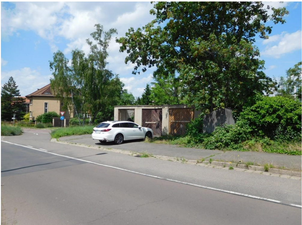
Straßenansicht - Blick nach Nordwesten