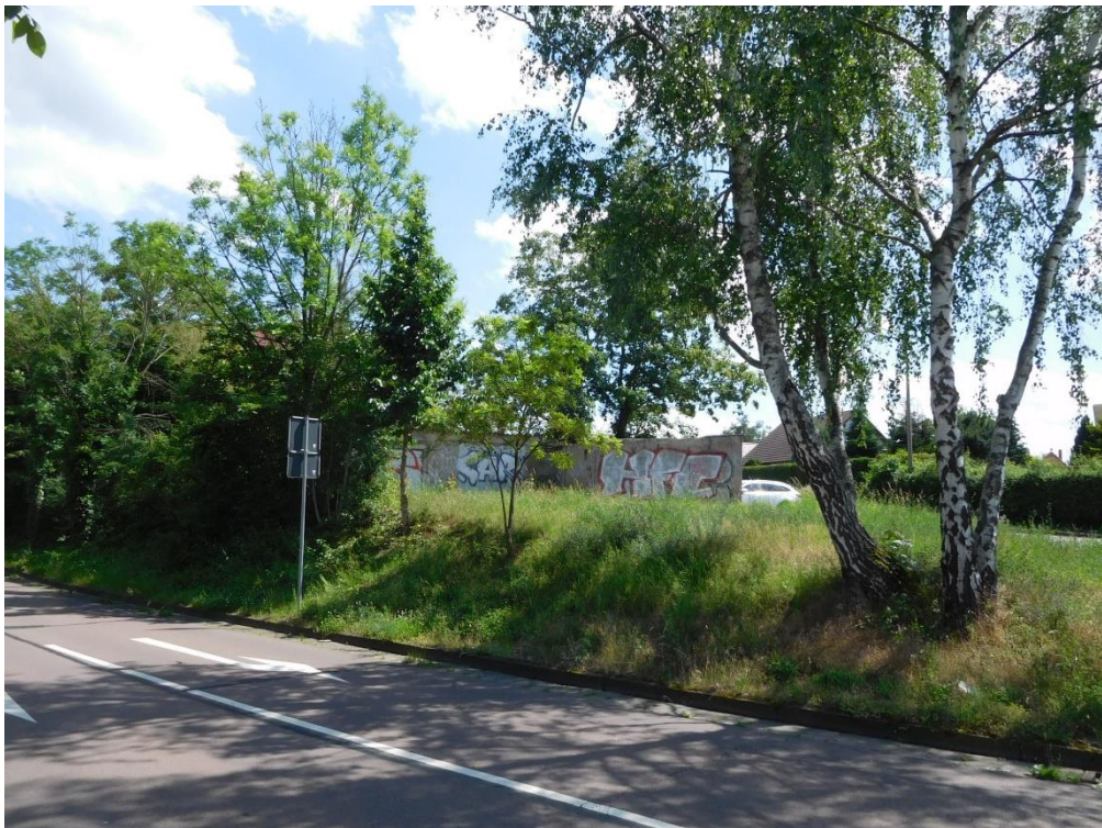
Rückwärtige Ansichten über die nördliche Fahrbahn der Wolfensteinstraße