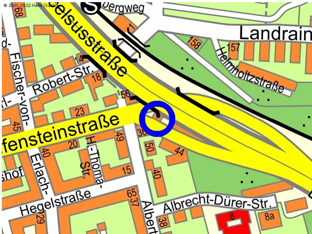
Auszüge aus dem Amtlichen Stadtplan der Stadt Halle (Saale)