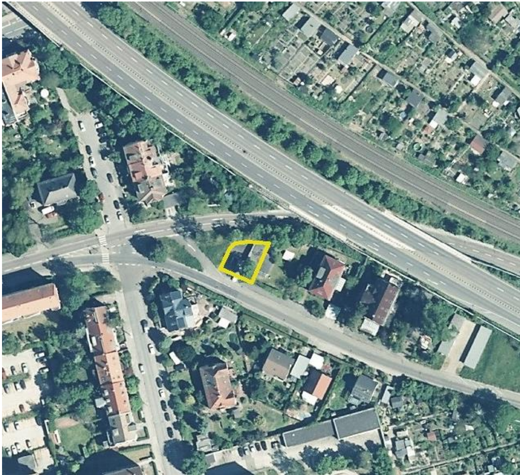
Luftbild mit markierter Verkaufsfläche