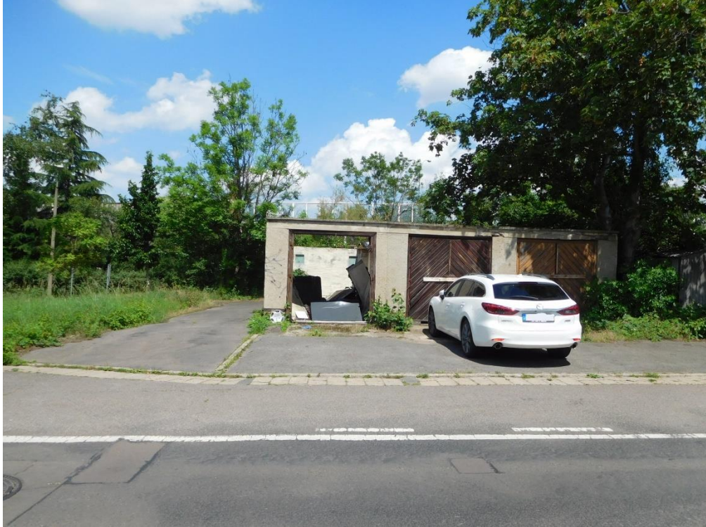
Teilansicht von Süden