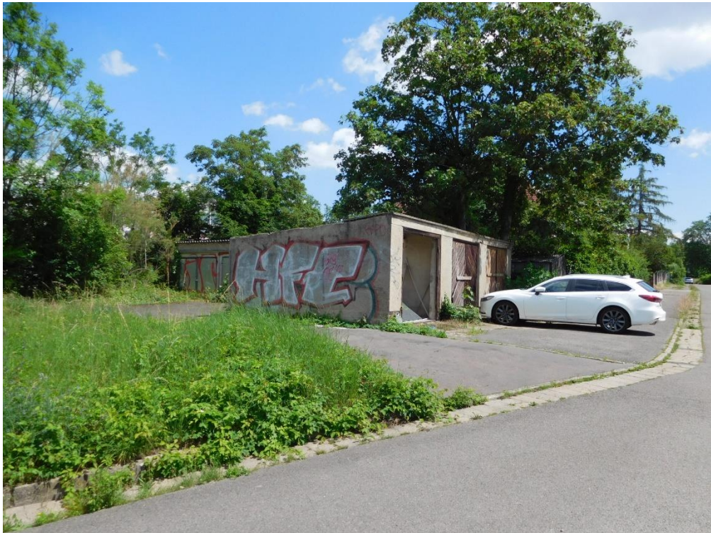
Teilansicht von Südwesten