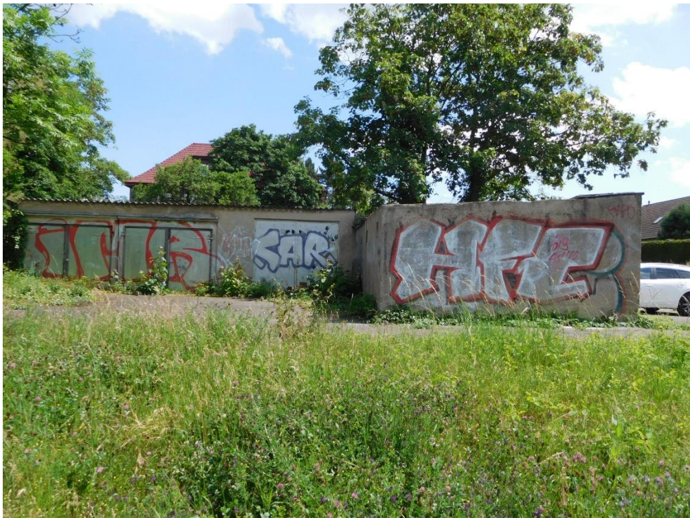
Teilansicht von Westen