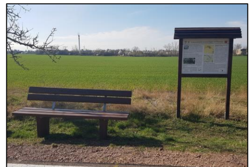
Sitzgelegenheit und Infotafel am geplanten Standort für die Schutzhütte

Mit Mitteln der Pflege- und Entwicklungskonzeption soll am Wipperradweg bei Ilberstedt an einem Raststandort eine Schutzhütte errichtet werden. Damit wird den Nutzern des Wipperradweges zwischen Bernburg und Ilberstedt die Möglichkeit zum Unterstellen gegeben.