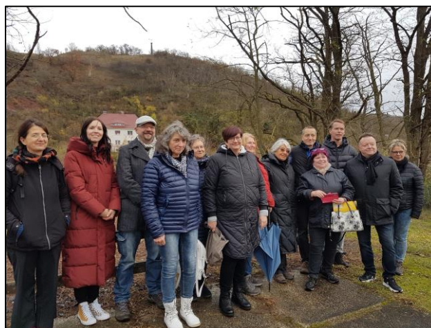
Presstetermin zur Entbuschungsmaßnahme auf der Schlackenhalde in Rothenburg

Der Saalekreis förderte mit einer finanziellen Zuwendung an unseren Naturpark die Entbuschung der ehemaligen Schlackenhalde in Rothenburg. Dies ist besonders wichtig, da die Halde als Standort für Infotafeln des Vereins 500 Jahre Industriegeschichte in Rothenburg e.V. dient und gleichzeitig ein wichtiger Aussichtspunkt für Wanderer ist. Starker Robinienaufwuchs beeinträchtigte hier die Aussicht auf die beeindruckende Landschaft des Saaledurchbruchs. Zur Durchführung der Entbuschungsmaßnahme hatte der Naturpark Unteres Saaletal seine Partnerinstitution Stiftung evangelische Jugendhilfe St. Johannis Bernburg beauftragt.